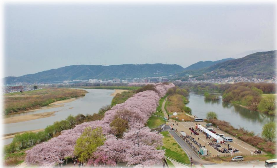
淀川の水害対策に作られた背割堤 —木津川：右岸，宇治川：左岸—（右岸左岸は上流から見る）